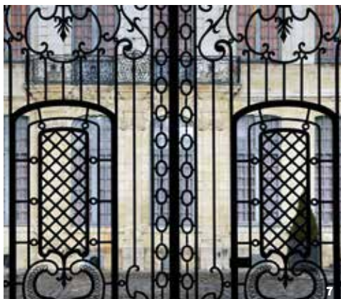
7. Grille de l'entrée principale