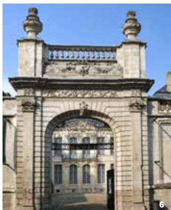
6. Entrée principale de l'hôtel Sandelin