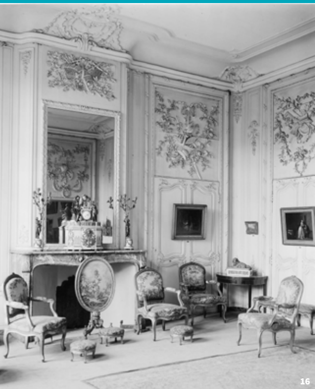
16. Présentation d'un salon 18 e du Musée Sandelin, carte postale ancienne