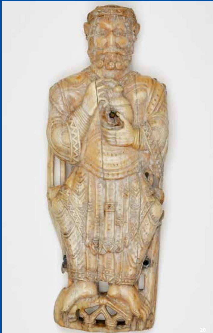
20. Vieillard de l'Apocalypse, vers 1100, ivoire de morse, Inv. 2484, Musée Sandelin

Aujourd'hui, le musée Sandelin propose trois parcours répartis sur trois niveaux. Le premier concerne l'art médiéval, le second les beaux-arts et le troisième les céramiques.