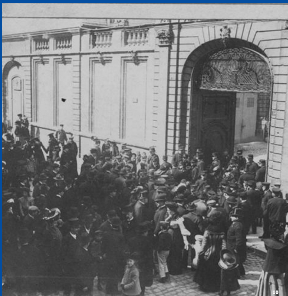
10. Inauguration du Musée de l'hôtel Sandelin en 1904, carte postale ancienne

En quelques décennies, l'ancienne demeure privée devient un musée public. Grâce à la communauté scientifique et la Ville de Saint-Omer, le patrimoine local se dote d'un écrin à la hauteur de son importance.