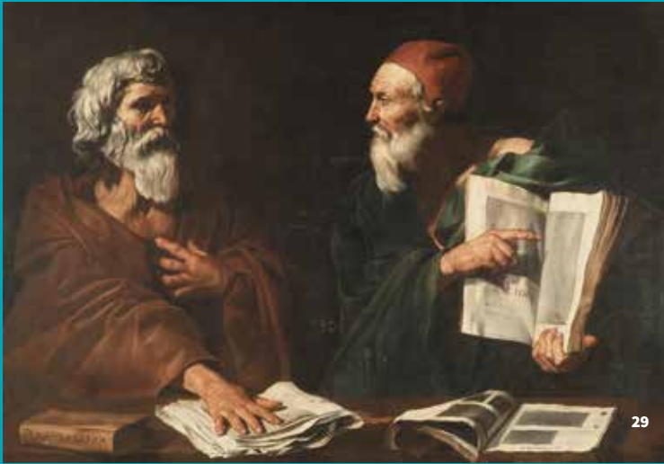
29. Jusepe de Ribera, Deux philosophes, vers 1635-1640, huile sur toile, Inv. 0242 CM, Musée Sandelin