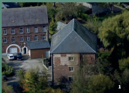
1. L'ancien moulin à farine et son magasin à blé, installés sur les berges de la Lys. Détail d'une photographie aérienne